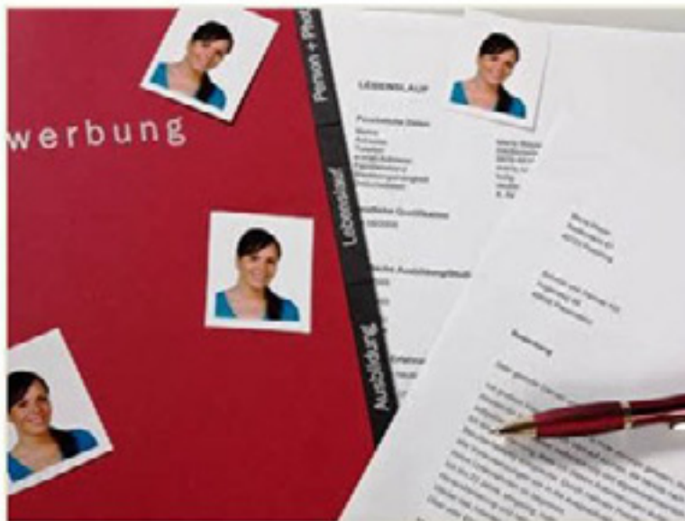
Bewerbungen sind für Anwärter und Firmen oft eine Herausforderung, die E-Books helfen weiter.

Für Bewerber aber auch Unternehmen gibt es im Internet kostenlos ein umfangreiches einschlägiges Nachschlagewerk: karrierehandbuch.de